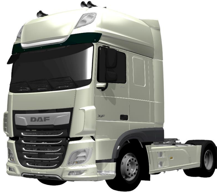
XF 530 FT 4X2 Çekici, 2022-10-17 | D0596565

Gösterilen görüntüler için herhangi bir hak elde edilemez